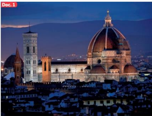
Catedral de Florencia (1420-1436)

La obra más famosa del arquitecto y escultor florentino Filippo Brunelleschi (1377-1446) fue la cúpula de la catedral de Florencia. Se trata de dos cúpulas que se superponen para repartir el peso. La técnica usada para su construcción fue un misterio durante seis siglos. Para esconder su truco, Brunelleschi hizo que los obreros dispusieran los ladrillos de la bóveda externa de manera distinta a los de la bóveda interna, que sostiene a la estructura. El resto del edificio es anterior a Brunelleschi y es de estilo gótico.