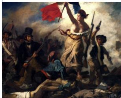
Delacroix, E. (1830). La libertad guiando al pueblo . París, Francia: Museo del Louvre.

Este cuadro representa un momento de las revoluciones liberales durante el año 1830 en Francia.