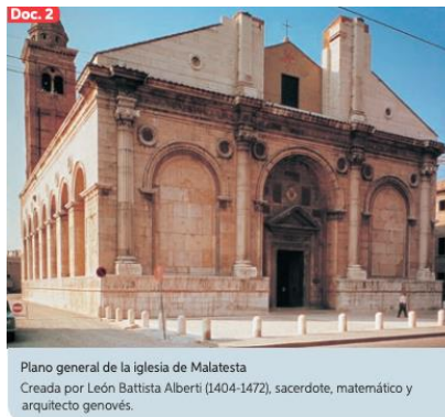
Plano general de la iglesia de Malatesta Creada por León Battista Alberti (1404-1472), sacerdote, matemático y arquitecto genovés.